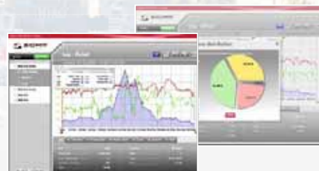
SIGMA DATA CENTER