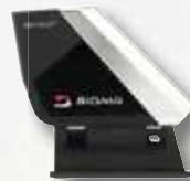
Vysílač frekvence otáček šlapání