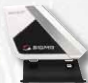
Vysílač frekvence otáček šlapání