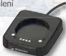
Základna pro připojení k PC