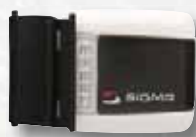
Vysílač rychlosti pro kolo 1+2

Základnu pro připojení k PC SIGMA DATA CENTER možno doobjednat (bez funkce LOG)